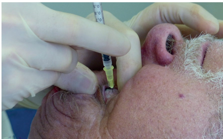
Obr. 1 Technika intravitreální aplikace

V prvním období (roky 2005–2011) – při ATB profylaxi dle SPC jsme aplikovali celkem 2651 injekcí (1087 x Macugen, 1092 x Lucentis, 101 x TMC, 371 x Avastin) (tab. 1). V tomto období byly evidovány dva případy endoftalmitidy (oba po