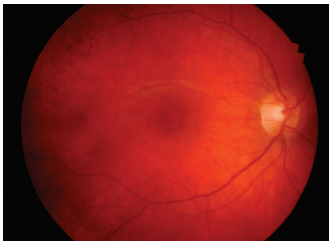
Obr. 5. Téměř úplná resorpce hvězdicové makulopatie pravého oka 2 měsíce po léčbě