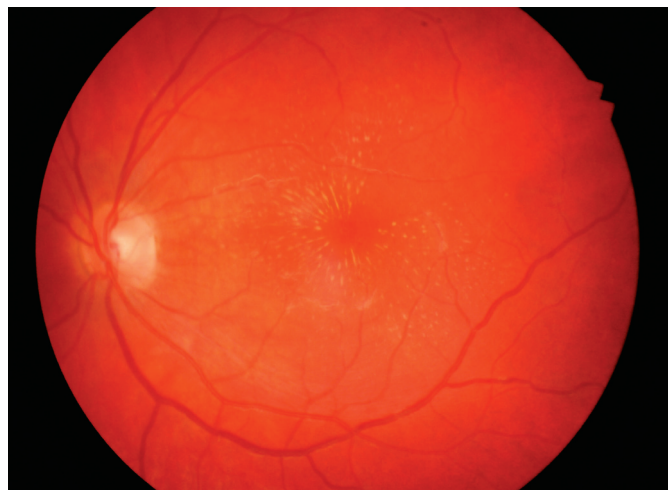
Obr. 2. Vstupní nález hvězdicové makulopatie levého oka