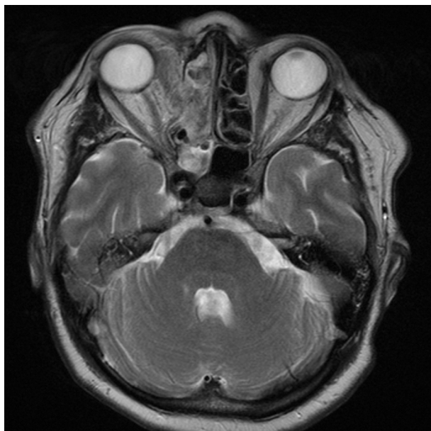
Obr. 6. MR, axiální řez, 1. pooperační den – tumor je kompletně odstraněn

prokázala nádorové postižení ledviny, metastatické postižení jater, plic, skeletu. Jako primární ložisko zvažováno tlusté střevo či ledvina. Pacient je t.č. v onkologické péči.