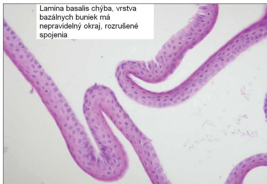
Obr. 2. Epitelialný flap vytvorený s pomocou alkoholu, lamina basalis nie je prítomná