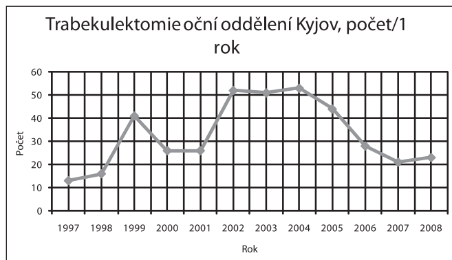
Graf 2. Počet trabekulektomií za rok prováděné na očním oddělení Nemocnice Kyjov

V roce 1830 Mackenzie popsal sklerektomii a později paracentézu, ale zjistil, že zákroky mají jen dočasný účinek. V roce 1968 Cairns zavedl trabekulektomii pod sklerálním lalokem. Dle záznamů z operační knihy očního oddělení nemocnice Kyjov se od roku 1972 prováděla iridocleisis, od roku 1973 sklerální trepanace sec. Elliot, od roku 1975 trabekulotomie a od roku 1976 trabekulektomie, TE se do roku 1996 provádělo každoročně do 10 pacientů, v dalších letech se počty TE výrazně zvýšily (graf 2).