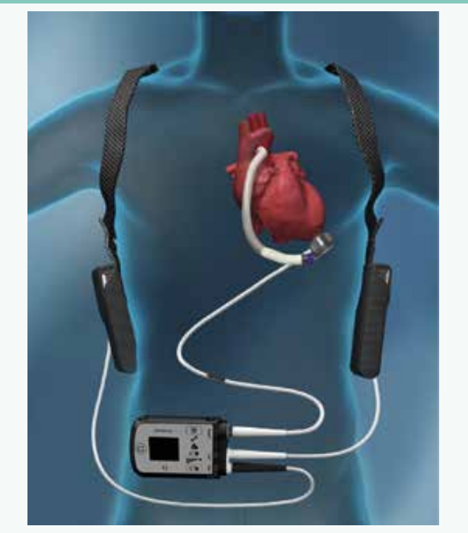
Schéma | Vliv implantace mechanické srdeční podpory (Heart Mate II nebo 3) a cévních parametrů (pulztilního indexu v karotických tepnách a augmentačního indexu) na klinické příhody (median sledování 27 měsíců)