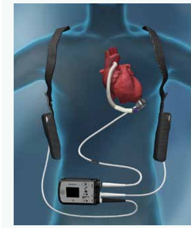
Obr | Mechanická srdeční podpora HeartMate 3 (použito se svolením společnosti Abbott U.S.)