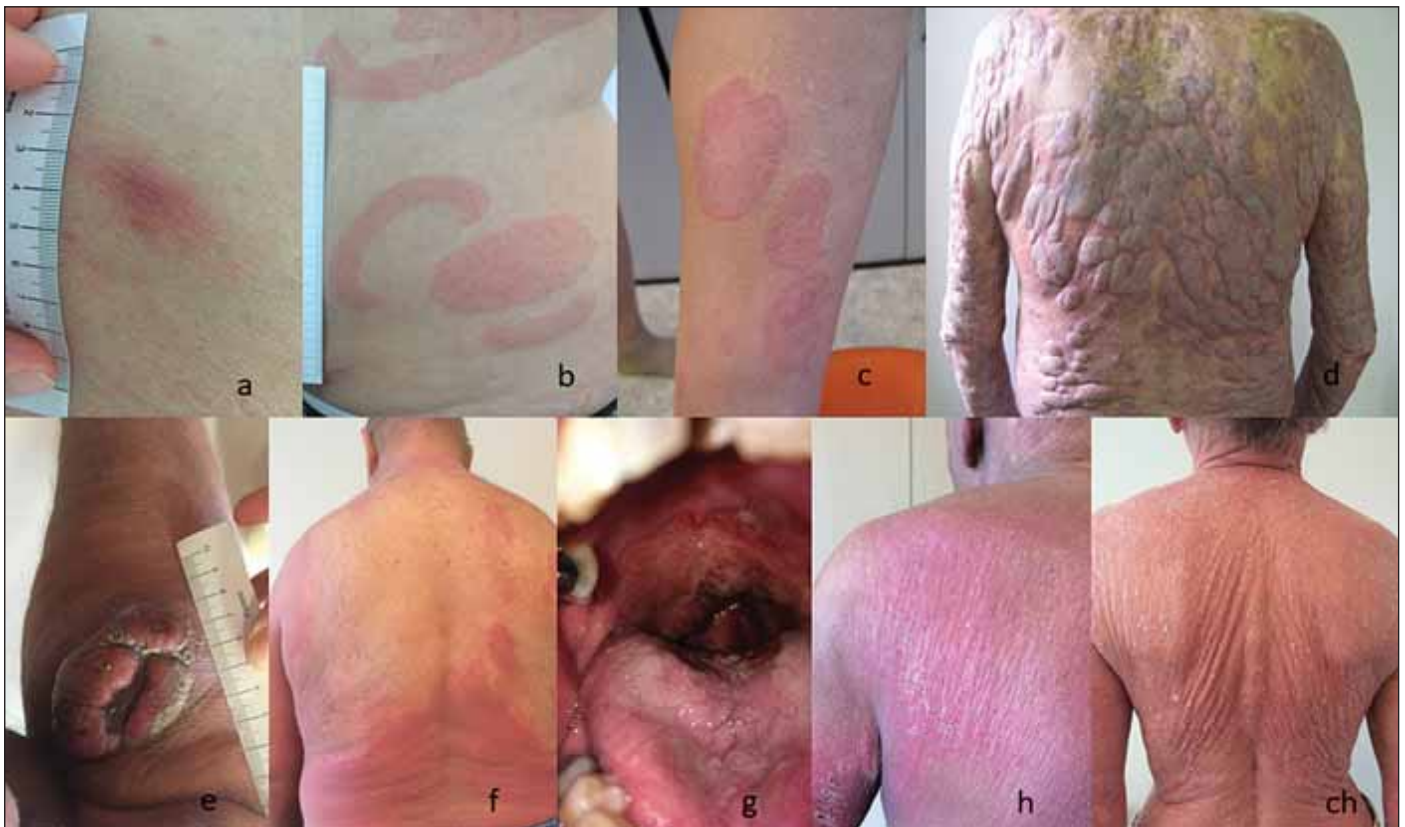
Obr. 1. Projevy MF a SS; fotografie autora článku.

(a) stádium skvrn (patch) MF, (b, c) infiltrativní stádium MF (plaque); (d, e) tumorozní stádium MF; (f) erythrodermické stádium MF; (g) MF mimokožní systémové postižení; (h, ch) SS (erythrodermie) MF – mycosis fungoides, SS – Sézaryho syndrom