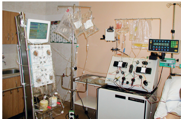
Foto 1 Přístrojové vybavení při LDL-aféze.

Princip reohemaferézy (RHF): U RHF je plazma, získaná stejným postupem jako u IA, proháňena "dru-