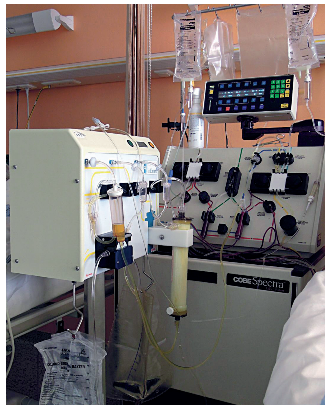
Foto 2 Přístrojové vybavení při reoferéze.

o toxicitu ACD-A (mírné klinické příznaky hypokalémie). Po infuzi s kalcíem (Calcium gluconicum 10%, Braun) došlo k vymizení potíží. Infuze s kalcíem u našich pacientů nepodáváme standardně při každém