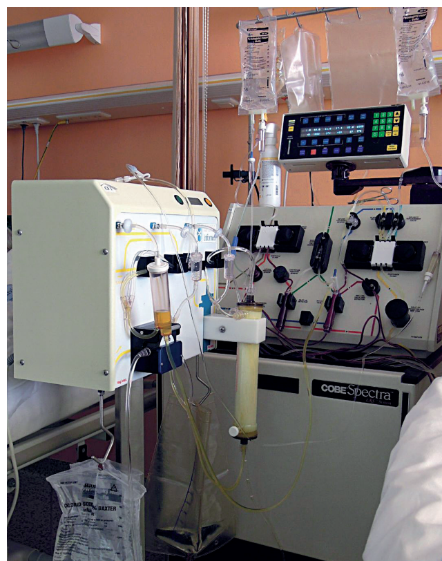
Foto 2 Přístrojové vybavení při reoferéze.

o toxicitu ACD-A (mírné klinické příznaky hypokalémie). Po infuzi s kalcium (Calcium gluconicum 10%, Braun) došlo k vymizení potíží. Infuze s kalcium u našich pacientů nepodáváme standardně při každém