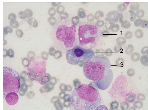
Obr. 1. Obraz megaloblastické přestavby kostní dřevě u našeho nemocného – gigantická tyč (1), megaloblast ortochromní s bazofilním tečkovaním (2), megaloblast polychromní (3), barvení May-Grünwald Giemsa, zvětšení 1000 x