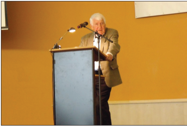
Obr. 3. Profesor Riehm při přednášce.

vzpomínal na první zkušenosti s aplikací jím vytvořených léčebných protokolů v západním Berlíně, odkud se inovativní a do té doby používané zásady léčby zásadně měnící léčba dětské ALL šířila do celé Spolkové Republiky Německo a následně do řady zemí světa. Principem léčebného přístupu byla velmi intenzivní dvouměsíční iniciační léčba skládající se z osmi cytostatik podaných v přesném časovém schématu a pozdní posílení (intenzifikace) léčby 6 měsíců od diagnózy obdobnými léky. Protokol byl kromě berlínské kliniky používán na dětských klinikách v Münsteru a ve Frankfurtu (odtud pochází název protokolu BFM používaný dosud). Svět v té době používal americké protokoly s šancí na vyléčení dětí s leukemií 30 %. Německými protokoly se vyléčilo v druhé polovině 70. let a v osmdesátých letech šedesát a následně 70 % dětí a staly se standardem léčby, jehož klíčové součásti používá většina vedoucích leukemických skupin včetně např. USA a Japonska.