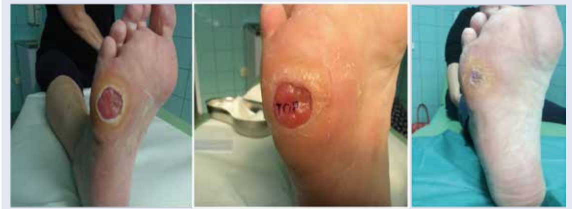
Obr. 3 | Instilácia Heberprotu-P do spodiny a okrajov dlhodobo sa nehojacej neuropatickej ulcerácie