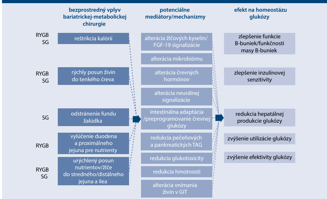
Schéma 17.2 | Mechanizmy vedúce k zlepšeniu homeostázy glukózy po bariatrickej/metabolickej chirurgii u diabetikov 2. typu

FGF-19 – ileom derivovaný enterokín GIT – gastrointestinálny trakt RYGB – Roux-en-Y gastrický bypass SG – sleeve/rukávová gastrektómia TAG – triacylglyceroly