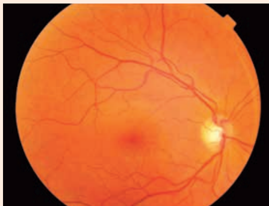
Obr. 5 a 6. Farebná fotografia fundu 8 týždňov po pôrode, nález stabilizovaný