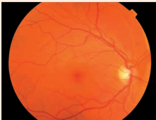
Obr. 1 a 2. Nález na očnom pozadí pravého a ľavého oka v 1. trimestri (farebná fotografia fundu). Na obidvoch očiach v makulárnej oblasti ojedinele mikroaneuryzmy