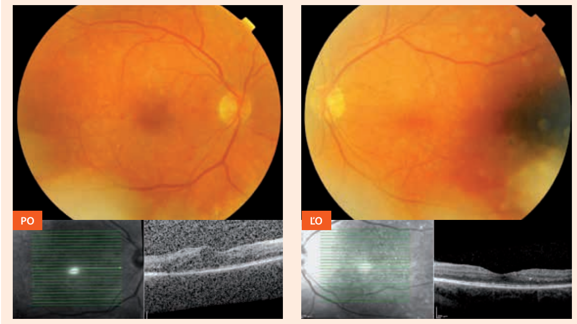
Obr. 4. Nález 2 mesiace po pôrode (3. 6. 2013): makula obojstranne bez edému, DR v tzv. kľudovom štádiu PO – pravé oko ĽO – ľavé oko