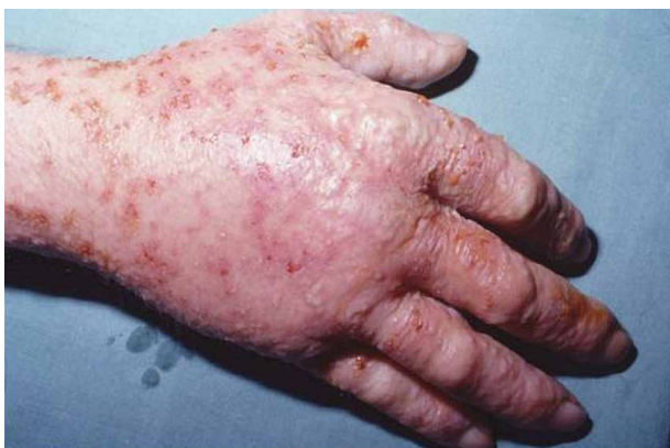
Obr. 2. Akutní dyshidrotický ekzém ruky

bý stav a pod pojmem chronický pak dlouhodobý, vleklý stav. Čím déle ekzém přetrvává, tím je přechod do chronicity pravděpodobnější, a to i po odstranění vyvolávající příčiny [8, 34]. Chronický ekzém může být recidivující (s exacerbacemi a remisemi) nebo perzistující (souvislý, trvale nepříznivý stav). Dermatologa obvykle vyhledají až ti pacienti, kteří mají postižení rukou již dlouhodobé, kde obvyklá léčba nevede ke zhojení či alespoň k dostatečnému zlepšení. V současné definici chronického ekzému rukou nefiguruje chronicita jako označení z hlediska stadia ekzému nebo celkové délky trvání ekzému, ale z hlediska průběhu navzdory léčbě: chronický ekzém ruky (CHE) definuje Evropská společnost pro kontaktní dermatitidu (ESCD) jako takový ekzém, který přetrvává déle než tři měsíce navzdory léčbě nebo recidivuje dva- a vícekrát v posledních 12 měsících po kompletním zhojení mezi exacerbacemi [6, 34, 37, 38]. Za akutní ekzém se pak považuje takový, který netrvá déle jak tři měsíce a exacerbace není častěji než 1krát/rok. S touto definicí pracují všechny dosavadní evropské doporučené postupy a doporučuje ji současná evropská odborná literatura.