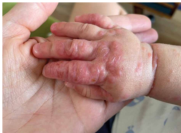
Obr. 4. Atopický ekzém rukou u kojence

Komplikace představuje vznik kontaktní senzibilizace na chemické, proteinové či mikrobiální alergeny. U CHE může dojít k bakteriální superinfekci (impetiginizaci), v oblasti nehtů pak k onychodystrofiím (obr. 5) a také komplikacím jako jsou paronychia, popř. infekč-