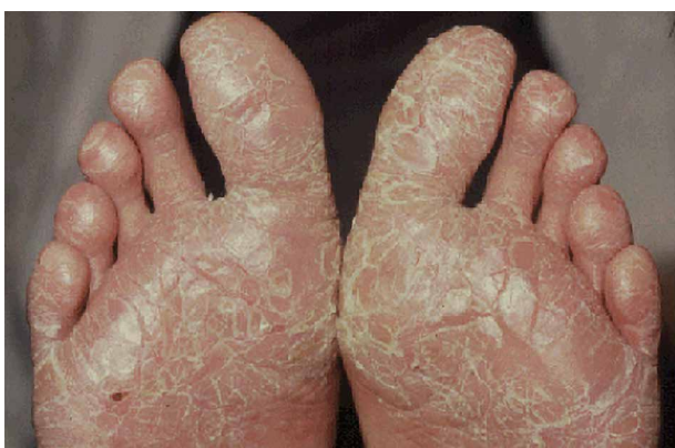
Obr. 1. Hyperkeratotický ekzém plosek

Podle stadia ekzému (fáze kožní choroby) lze ekzém označit za akutní, subakutní či chronický, což má význam především pro volbu galenické formy v lokální léčbě. Jako akutní a chronický se ekzém rozlišuje především dle trvání, kde se pod pojmem akutní rozumí krátkodo-