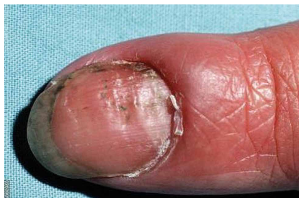
Obr. 5. Paronychia a onychodystrofie u ekzému rukou

ním komplikacím jako panaricia. Může být přítomna i mykotická infekce, a to jak v důsledku narušené kožní bariéry, tak i dlouhodobé lokální kortikoidní léčby.