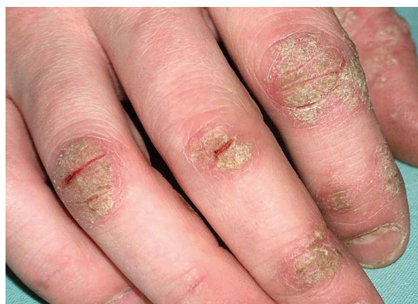
Obr. 3. Hyperkeratotický ekzém prstů

Morfologie ekzému ruky je heterogenní. Různé morfologické projevy a jejich závažnost se mohou překrývat, v čase měnit, a tak může být klinický obraz nejen proměnlivý, ale nabývat u chronického pacienta i polymorfního charakteru. V klasifikaci ekzému rukou proto nepanovala nikdy jednotnost. Recentní odborná literatura v zásadě rozlišuje dva hlavní, nejčastější klinické subtypy HE [6, 15, 34, 37, 38], a to dyshidrotický a hyperkeratotický subtyp (obr. 1 a 2), a uvádí ještě i další – tabulka 1.