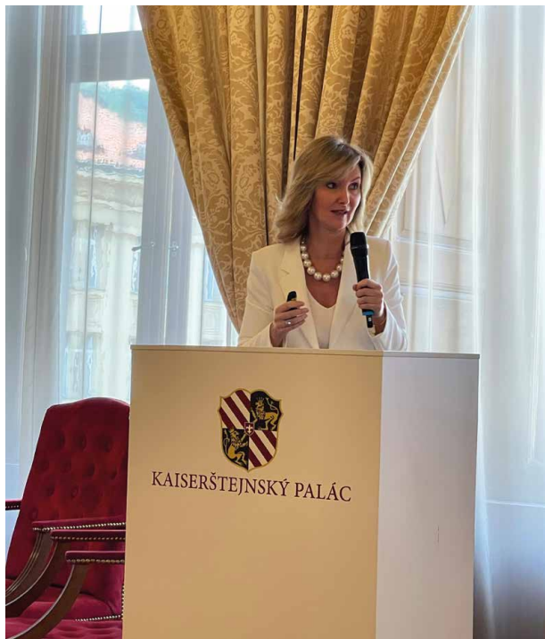
Choroby vlasů nesmíme přehlížet

nabízí celou řadu možností, jak i tyto choroby úspěšně zvládat. Vše bylo dokumentováno na úrovni evidence-based medicine i kazuistickými příklady. Její přednáška „Nechme na hlavě“ tak i zatím nepřesvědčeného posluchače ubezpečila o tom, že chybění vlasů zaručeně není jen vadou na kráse.