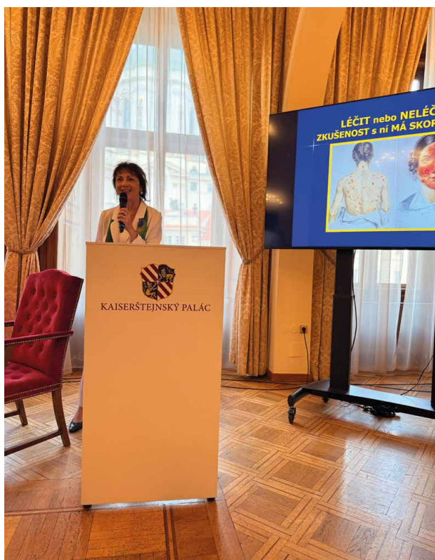
Léčit nebo neléčit akné

by to bylo potřeba při naplnění postulátu o pravidelných vyšetřeních kůže. Závěrem přednášky jsem ale na konkrétních datech zdůraznil, že i pacienti v pokročilých stadiích zhoubných kožních nádorů mají dnes díky moderní biologické a další cílené léčbě desetinasobně lepší šance na přežití, než tomu bylo před patnácti lety. Nelze na to ale spoléhat, úplné vyléčení lze stále nabídnout jen tomu, kdo přijde včas.