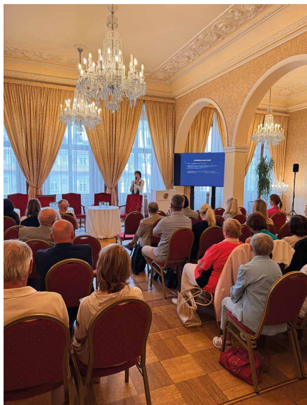
Sál se rychle zaplnil