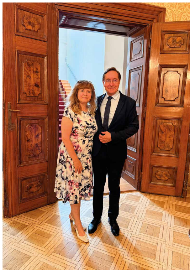
Představitelé pořadatelů semináře