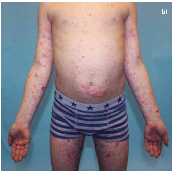
Obr. 2. a, b. 7letý chlapec s 2 měsíce trvajícím projevem, histologie PLEVA