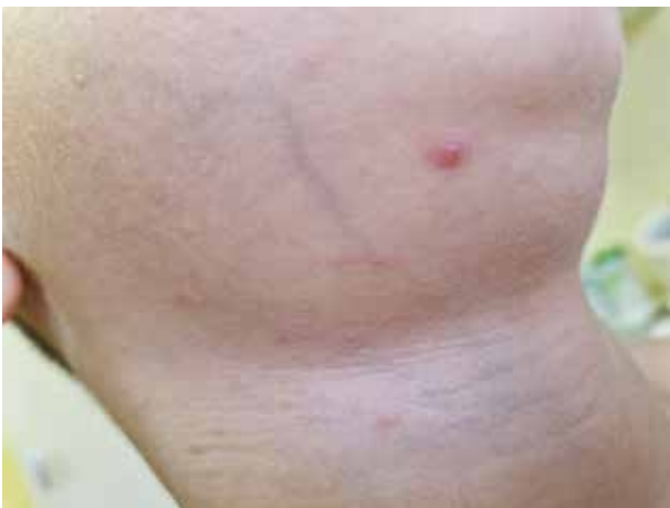
Obr. 8. Ojedinělý projev PL v obličeji