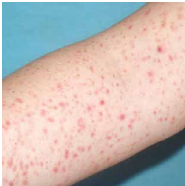
Obr. 4. Histologicky ověřená PLC