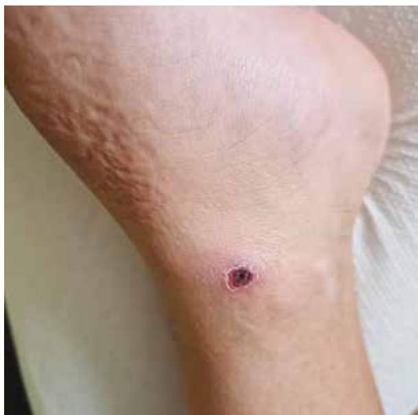
Obr. 3. 5letý chlapec s 8 měsíců trvajícím makulopapulózním výsevem, posléze přecházejícím do ojedinělých krust. Histologie neprovedena.