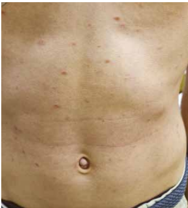
Obr. 1. 14letý chlapec se 7 měsíců trvajícím projevem Histologie prokázala PLEVA, klinicky bez krust, stav po 2 měsících fototerapie NB-UVB.