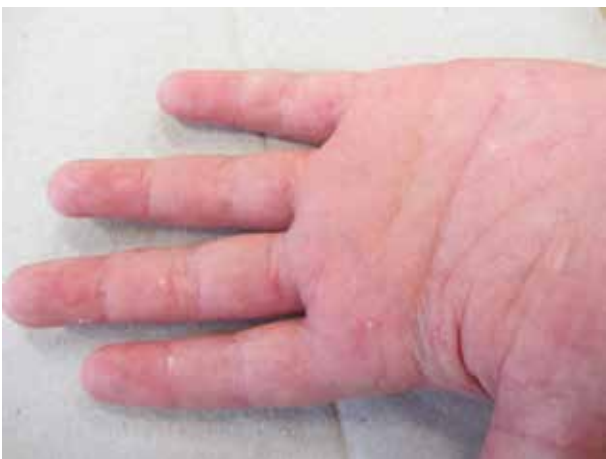
Obr. 9. Solitární projev PL v dlani

Subjektivně bývá pociťováno mírně svědění, nebo jsou projevy asymptomatické, zřídka bolestivé či výrazně svědicí. Celkové příznaky jsou ojedinělé a mírné – febrilie (6 %) a bolesti kloubů (3 %).