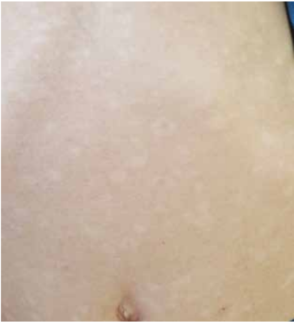
Obr. 7. 6letý chlapec, 2 měsíce trvající onemocnění, remise papul do hypopigmentací spontánně po letních měsících