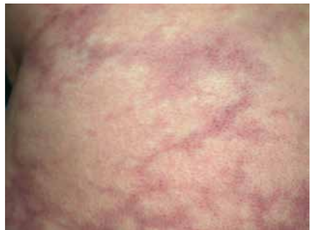
Obr. 5. Příklad projevů typu livedo reticularis