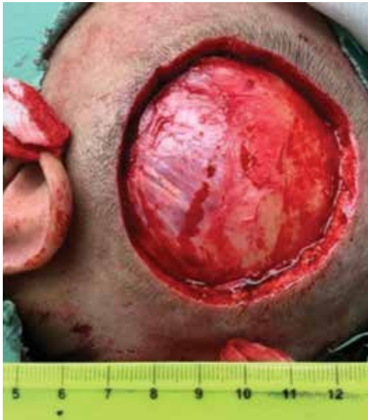
Obr. 4. Po excizi tumoru