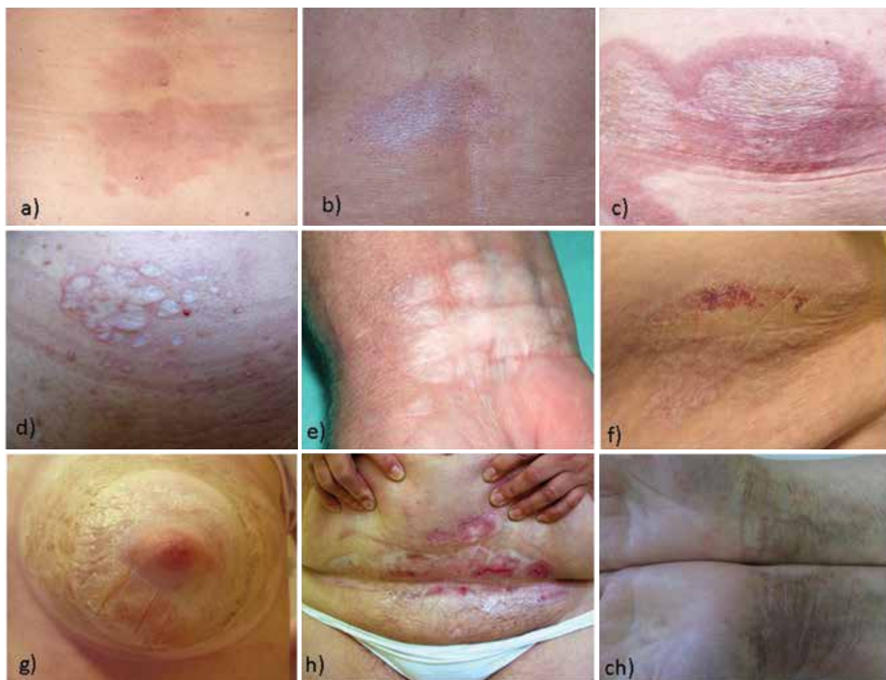
Obr. 3. Erytémy s naznačenými bělavými lesklými makulami (a), později jasně zřetelnými (b), splývajícími do ložisek se zřaseným povrchem (c), někdy s tvorbou bělavých papul splývajících do ložisek s drsným povrchem podmíněným bodovitými, folikulárně vázanými hyperkeratózami (d), (e), někdy až ploch s prosáklým povrchem s hemoragiemi (f), někdy s tvorbou bul (g), přecházejících do erozí (h), po ústupu jsou často patrné reziduální šedohnědavé pigmentace (ch)

Vzhledem k tomu, že LS vulvy postihuje zejména prepubertální dívky a peri- či postmenopauzální ženy, je možná role pohlavních hormonů. Výskyt LS též negativně koreloval s aplikací antikoncepce obsahující pouze progesteron [21]. Příznivý účinek lokální aplikace testosteronu, estrogenů, progesteronu, substituční hormonální léčby však nebyl prokázán [27].