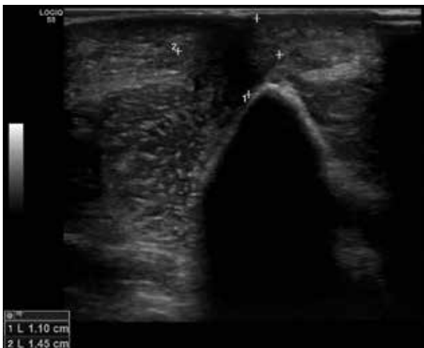
Obr. 5. Sonografický nález fibrózního uzlu v podkoží pravého loktu před léčbou antibiotiky

Klinicky se ACA projevuje 6 měsíců až 8 let po nákaze. Jen 30 % pacientů udává prodělané erythema migrans