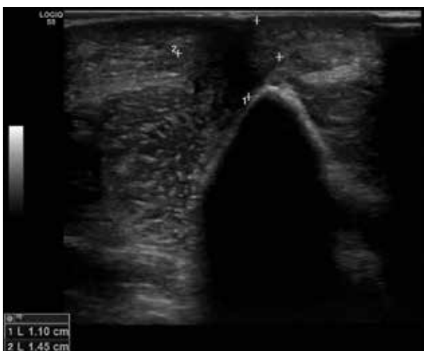
Obr. 5. Sonografický nález fibrózního uzlu v podkoží pravého loktu před léčbou antibiotiky

Klinicky se ACA projevuje 6 měsíců až 8 let po nákaze. Jen 30 % pacientů udává prodělané erythema migrans