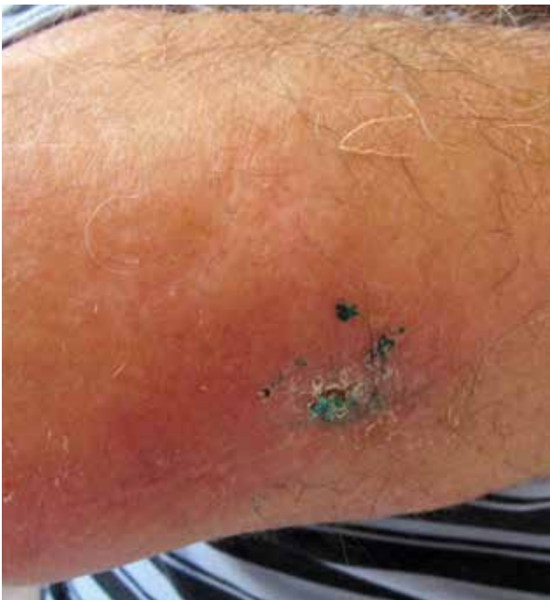
Obr. 2. Lividně-erytémové zbarvení a hmatná podkožní indurace v oblasti při pravém lokti, po probatorní excizi

vat externa s nesteroidními antiflogistiky, vyvazovat končetinu elastickým kompresivním obinadlem a celkově užívat aceklofenak. Potíže se stupňovaly poslední 4 měsíce. Kromě edému, který mu částečně bránil v hybnosti, pociťoval i bolest a tlak v celé pravé horní končetině. Při vstupním kožním vyšetření byla viditelná velmi výrazná asymetrie ve prospěch PHK, na paži + 4 cm, na předloktí + 1,5 cm a zápěstí + 2 cm v obvodu, současně edém všech prstů pravé ruky. Končetina měla erytémové a místy lividní zbarvení, palpačně byla hmatná indurace na dorzu ruky a v okolí jizvy u loktu po výkonu, která nebyla teplejší než okolí (obr. 1, 2). Za hospitalizace byla provedena základní laboratorní vyšetření a RTG plic – bez patologických nálezů. Vyšetření antiboreliových protilátek metodou ELISA bylo vysoce pozitivní ve třídě IgG – 11,240 (referenční meze: pod 0,9 negativní, 0,9–1,1 hraniční, nad 1,1 pozitivní) a negativní ve třídě IgM. Z indurace v blízkosti loktu