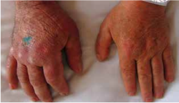
Obr. 1. Stranová diference horních končetin – otok a lividně-erytémové změny PHK, hojící se rána po probatorní excizi na dorzu ruky