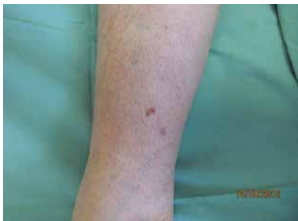
Obr. 1. Klinický obraz

Pacientka (64 let) III. fototypu se dostavila k pravidelné dispenzární kontrole po operaci bazaliomu, který byl odstraněn o 5 roků dříve z bederní krajiny. Ventrálně v distální části pravého bérce byla nalezena plochá, zcela nepatrně palpovatelná afekce velikosti 10 mm. V jedné její polovině byla necharakteristická plošná hnědá pigmentace, v druhé polovině byla léze růžová (obr. 1).