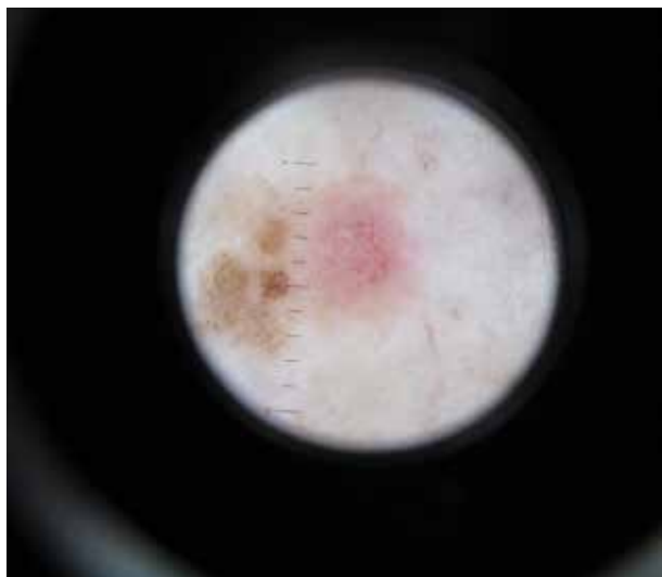
Obr. 2. Dermatoskopický obraz

Dermatoskopický nález – v proximální části projevu byly viditelné nepravidelně distribuované převážně tečkovité a méně glomerulární cévy na růžovém pozadí. V distální části byly nepravidelně rozložené nečetné hnědé globule a difuzní hnědé bezstrukturní světle- a tmavohnědé plochy. Okolí nebylo zánětlivé ani jizevnatě změněno (obr. 2).