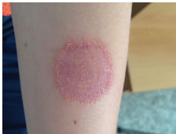
Obr. 3. Tinea corporis na levém předloktí třetího pacienta – červenofialové šupící se ložisko pokryté papulkami

Pacient (chlapec, 12 let) se dostavil k lékaři kvůli rozšiřujícímu se ložisku na levém předloktí. Objektivně bylo zjištěno červenofialové ložisko o velikosti 35 mm šířící se valem do okolí (obr. 3). Ložisko bylo živé, ve středu se šupilo, spíše nesvědilo a bylo pokryto výraznějšími papulkami. Chlapec byl v dětství léčen opakovaně pro ekzém v obličeji, loketních a podkolenních jamkách. Nyní je již delší dobu bez potíží. Rodina doma chovala ježka bělobřichého a babička měla kočku. Na zvířatech nepozorovali žádné klinické známky kožního onemocnění.