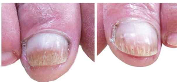
Obr. 3b. Nehtové ploténky palců obou dolních končetin po sedmi měsících od první aplikace NTP: bez hyperkeratóz na distálních stranách, odrůstají nehtové ploténky do půl až dvou třetin délky. Ostatní nehty bez mykotických změn.