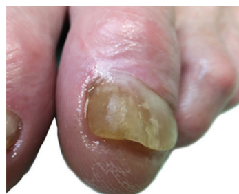
Obr. 4b. Nehty dolní končetiny při kontrole po šesti měsících od první aplikace NTP. Proximálně je po celé bázi patrná odrůstající zdravá nehtová ploténka v délce cca 5–6 mm. Nehet má v distální části rovné okraje bez hyperkeratóz. Mediální hrana nehtu je elevována korekcí zarůstajícího nehtu a shora fixována speciálním akrylem.