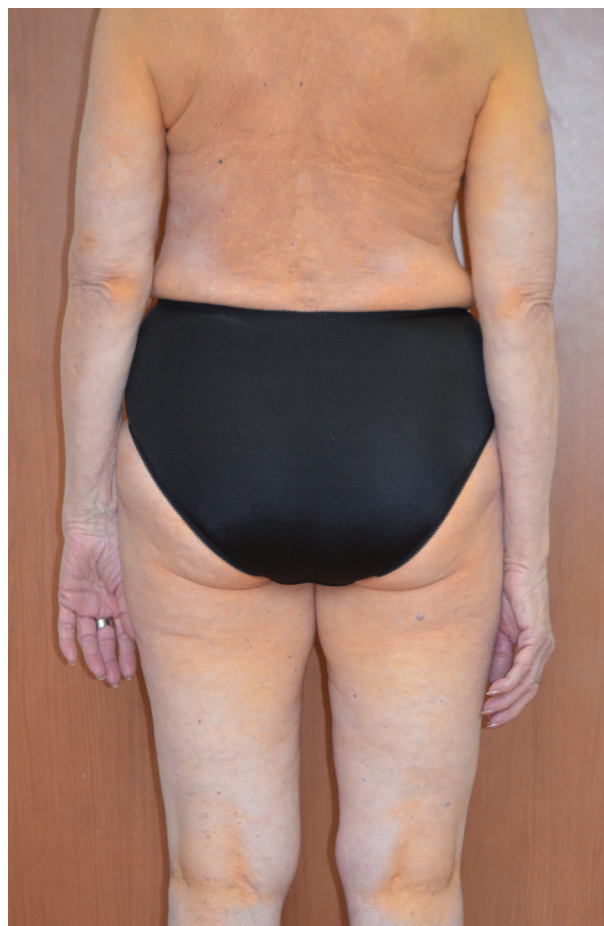
Obr. 2. Postižení v podkolenních jamkách