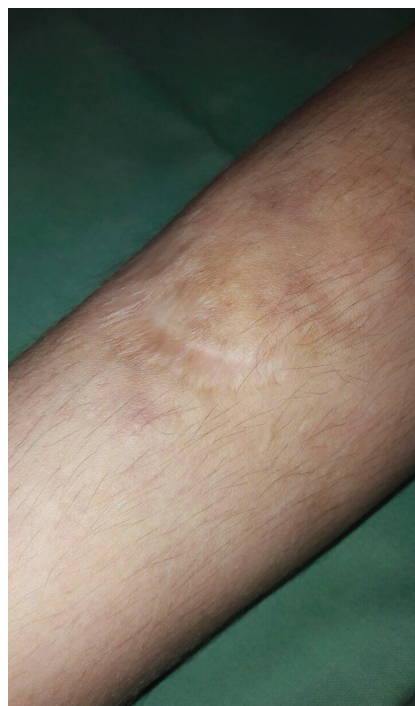
Obr. 4. Atrofické rozeklané jizvy a hematomy na bérce

V kojeneckém věku byl pacient hospitalizován pro neprospívání. Ve 4 letech měl frakturu pravé klavikuly a v 5 letech si způsobil tržnou ránu na bérce vyžadující suturu, která se zhojila rozeklanou atrofickou jizvou. U pacienta byly typické známky klasické formy Ehlersova-Danlosova syndromu. Jemná, hebká kůže s nadměrnou kožní řasou, těstovité podkoží, hyperflexibilita kloubů, pozitivní příznak palce (obr. 1, 2). Na čele měl jizvy charakteru cigaretového papíru, na bérkách byla patrna atrofická kůže v místě resorbujících se hematomů, hematomy průměru