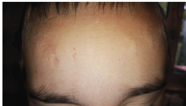
Obr. 3. Jizva charakteru cigaretového papíru na čele

syndromu – těstovité podkoží, rozeklané jizvy, hematomy na bérkách, hyperelasticitu kůže, hyperflexibilitu kloubů, kyfokoliózu, chronickou žilní insuficienci.