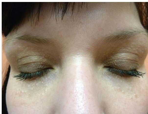
Obr. 1. Syringomy v okolí očí

Při vyšetření jsme kolem očí našli mnohočetné, polokulovité, hladké papuly 1–5 mm velké, normální barvy, které ji subjektivně neobtěžovaly (obr. 1). Diferenciálně diagnosticky jsme zvažovali především syringomy, a to i s ohledem na rodinnou anamnézu. Pro potvrzení dia-