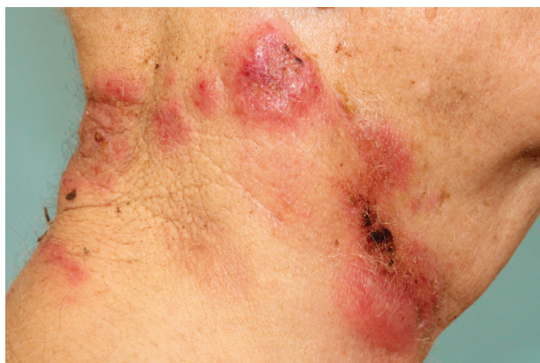
Obr. 2. Palpačně bolestivé infiltráty na kůži krku, některé anulárního uspořádání