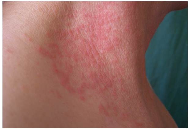
Obr. 11. Airborne alergická kontaktní dermatitida po kalafuně

Prevalence výskytu airborne AKD se udává od 0,6 % do 3,2 % v závislosti na studované populaci [11, 54]. Vý-