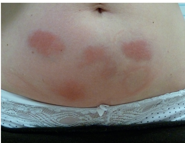
Obr. 2. Reakce v místě aplikace injekcí anakinry u pacientky léčené pro HIDS

Monogenní syndromy vznikají na podkladě mutací genů pro proteiny vrozené imunity, které jsou součástí NLRP3 inflamasomu, cytokinových receptorů či jejich antagonistů, nejčastěji jde o geny pro pyrin a TNF receptory. Výsledkem mutací je porušená regulace vrozené imunity s abnormální aktivitou interleukinu 1 \beta a přetrváváním leukocytů ve tkáních, takže i mírné podněty pak mohou vyvolat nepřiměřenou zánětlivou reakci. Laboratorně