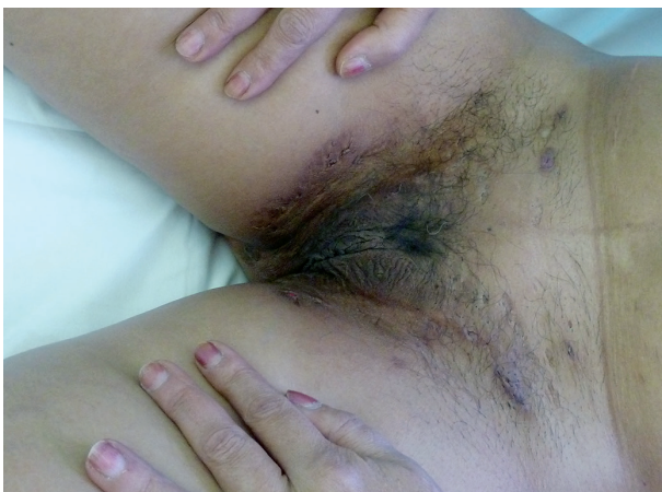
Obr. 6. Hidrosadenitis suppurativa v třísllech u téže pacientky

Tento autoinflamatorní syndrom patří mezi zcela nově popsané autoinflamatorní onemocnění, a to v roce 2012 Braun-Falcm, jr. Liší se od PAPA syndromu absencí epizod pyogenní artritidy. Pacienti mají acne conglobata a hidrosadenitis suppurativa , v těchto lokalitách může následně vzniknout pyoderma gangrenosum [3] – obr. 6, 7. Tyto syndromy se mohou různě sdružovat s dalšími nemocemi, takže se hovoří už o dalších nových akronymech: PAPASH (PASH a pyogenní arthritis), PsAPASH (psoriatická artritida a PASH) [Růžička T.: Autoinflama-