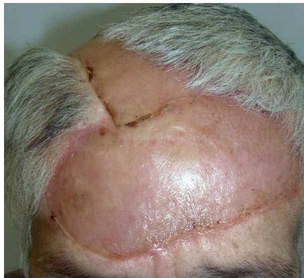
Obr. 1b. Stav po operaci

Laboratorní vyšetření před zahájením léčby (krevní obraz a základní biochemická vyšetření) byla normální. Kontrolní vyšetření jsme pak prováděli opakovaně v průběhu léčby a výsledky byly vždy v normě.