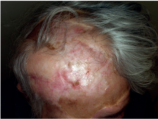
Obr. 3. Klinický nálezn bezprostředně po ukončení léčby (prosinec 2014)

o terapii 119 pacientů s lokálně pokročilým nebo metastatickým bazaliomem. Průměrná léčba vismodegibem byla 5,5 měsíce (rozmezí 0,4–19,6). Lék byl podáván perorálně v dávce 150 mg denně ve 28denních cyklech a po 1–2 cyklech se provádělo kontrolní vyšetření. Léčba se přerušila v případech progresu nádoru, výrazných vedlejších účinků nebo na žádost pacienta. Dávku léku nebylo možná snížit, ale v případech toxických projevů se léčba mohla až na 8 týdnů přerušit. Pozitivní léčebná odezva byla zaznamenána u 46,4 % lokálně rozvinutého a 30,8 % metastatického bazaliomu. Průměrná doba sledování byla 6,5 měsíce (rozmezí 1,4–20,6).