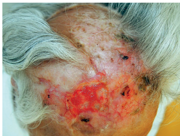
Obr. 2b. Klinický nález před zahájením léčby (červen 2014)