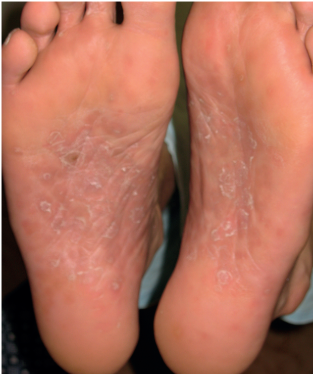
Obr. 3. Makulopapulózní exantém na chodidlech

Při přijetí v objektivním nálezu dominoval generalizovaný makulózní exantém a celkové ikterické zbarvení kůže a sklér (obr. 1). V oblasti obličeje kolem úst a také ve dlaních a na chodidlech měly kožní projevy makulopapulózní charakter (obr. 2, 3). Disperzně na integumentu byly přítomny drobné eroze a exkoriace, které byly důsledkem generalizovaného pruritu. V obou tříslích byly výrazně zvětšené nebolestivé uzliny a současně přetrvávaly výše uvedené subjektivní potíže a subfebrilie. Pacient byl astenického habitu s aktuálním BMI (Body Mass Index) 18,2.