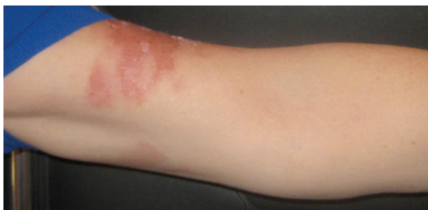
Obr. 4. Účastnice kongresu AAD Miami (duben) – 72 hodin po kontaktu se šťávou z limetky

Jde o divoce rostoucí i ušlechtilé byliny s typickým květenstvím – okolík (jednoduchý či složený) – obrázek 5. Obsahují významné množství furanokumarinů. Nejstarší využívaný zástupce pro fototoxické účinky je Morač větší, syn. Pakmín větší ( Ammi majus , false Bishop's weed).