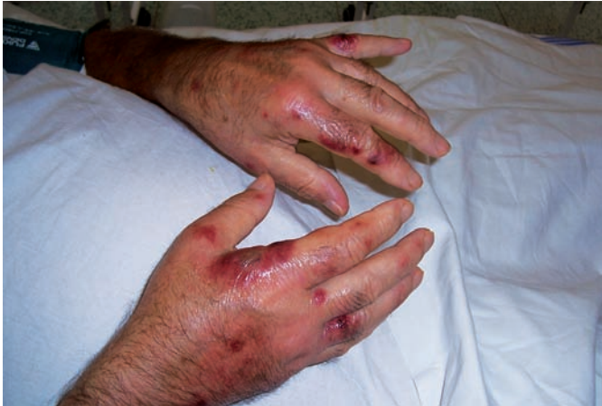
Obr. 1. Klinický obraz – kazuistika 1

7,33 \mu\text{kat/l} (norma 0,15–0,75), alfa- amyláza 0,8 \mu\text{kat/l} v normě (norma 0,1–1,7). Na rentgenovém snímku srdce a plic byla patrna elevace pravé bránice, ostatní nález byl bez patologie, sonografie popsala subfrenickou kolekci tekutiny. CT vyšetření břicha verifikovalo biliom („náborový“ útvar vzniklý nahromaděním žluči) v pravém subfreniu. Byla provedena drenáž této kolekce s úpravou antibiotické léčby – p. o. sultamicilin byl po 7 dnech užívání nahrazen i. v. cefoperazonem v dávce 1 g 2krát denně. Endoskopická retrográdní cholangiopankreatikografie popsala normální nález bez úniku kontrastní látky mimo žlučové cesty.