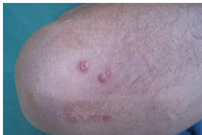
Obr. 1. Klinický nálezní obrázek necharakteristických papul u pacienta na pravém lokti v září 2009

V září 2009 byl vyšetřen na kožní ambulanci pro asi týden trvající asymptomatické kožní projevy. Objektivně bylo přítomno několik růžových tuhých papul s hemoragickou krustou v centru na obou loktech, levé ruce a na pravém uchu (obr. 1, 2, 3).