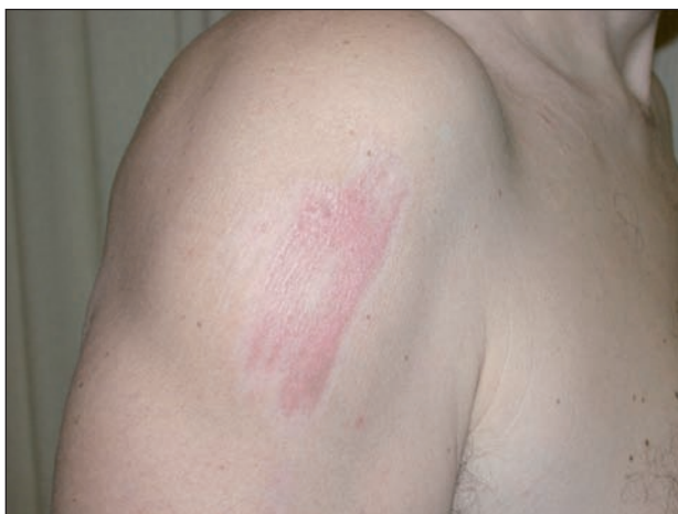
Obr. 2. Pacient měsíc po zranění

Pacient (51 let), zdravý, alergiemi netrpící sportovně založený lékař se při šnorchlování v Rudém moři škrábl na pravém rameni o drsný povrch korálového útesu. Po 5–10 minutách udával silné pálení. Po ošetření masť s 0,5% prednisolonu a 3% clioquinu a roztokem 10% jód-polyvidonu došlo k úlevě. Během dalšího pobytu u moře po dobu 5 dnů při koupání ve slané vodě rána silně štípala, nicméně neomezila aktivity pacienta včetně slunění při aplikaci SPF 50+. Pacient se od návratu domů léčil nepravdělnou aplikací kortikosteroidních extern – za měsíc bylo ložisko stále zarudlé, sestávající z lineárně uspořádaných splývajících lesklých červenohnědých makulopapul, citlivé na pohmat (obr. 2). Během dalšího měsíce došlo k postupné regresi klinických projevů. Za dva roky byly stopy po zranění stále zřetelné s depigmentací a hypertrofickou plošnou jizvou, i když postižený tvorbou hypertrofických nebo keloidních jizev netrpí.