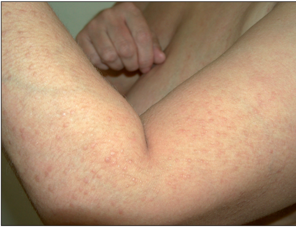
Obr. 1. Lichen amyloidosus – laterální strana levého předloktí a paže.