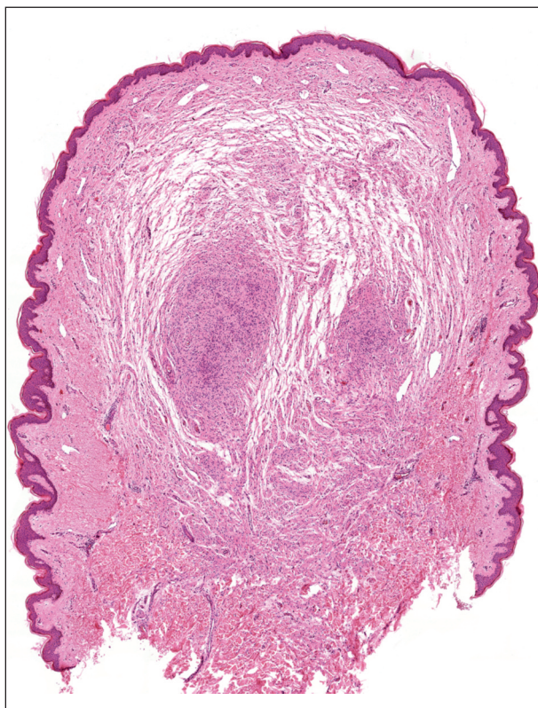
Obr. 2. Neurofibrom, hematoxylin-eozin, původní zvětšení 20x.

Klinický nález odpovídal segmentální neurofibromatóze, proto bylo doplněno komplexní kožní, neurologické, otorinolaryngologické a oční vyšetření, které neprokázalo patologické změny. Větší neurofibromy byly odstraněny excizí s hojením atrofickou jizvou. Vzhledem k absenci obtíží pacientka nebyla dále vyšetřována. V rodině paci-