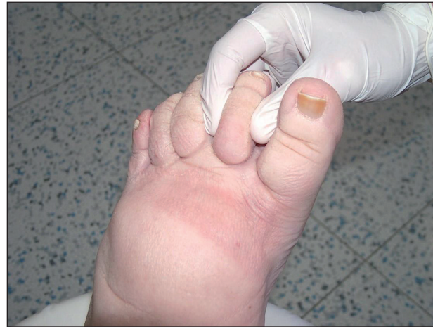
Obr. 5. Stemmerovo znamení (na druhém prstu nohy nelze vytvořit kožní řasu).

Lymfedém je otok, zpočátku chladný, měkký, mělký, bleďé barvy, nebolestivý; při palpaci v kůži lze vytlačit plastický, rychle mizející důlek. Postupem času otok tuhne, dochází k deformitě končetiny, která mění tvar, může dojít i ke vzniku elefantiázy. Zvláštní klinickou známkou lymfedému je Stemmerovo znamení (na 2. prstu nohy nelze vytvořit kožní řasu) (obr. 5). O lymfedému také svědčí nálezy zvláštního tvaru prstů, tzv. kvadrátních prstů , které vznikají působením tlaku okolí na měkké tkáni prstu, dále bradavičnaté kožní projevy – verruccosis lymphostatica , dále hyperkeratóza , zanořování vlasových folikulů do hloubky (kůže připomíná vzhled pomerančové kůry), atrofie až zánik nehtových plotének , xeróza , nálezy kožních puchýřků vyplněných lymfou ( chyloderma ), jejichž prasknutí je provázeno lymforeou . Tyto změny se mohou vytvořit i na genitálu při primárním lymfedému. Během dlouhodobého postižení může dojít ke vzniku vředu – ulcus lymphaticum . Lymfedém nejčastěji postihuje končetiny, ale může se manifestovat i v oblasti hlavy, krku, trupu nebo na genitálu. Otok bývá většinou