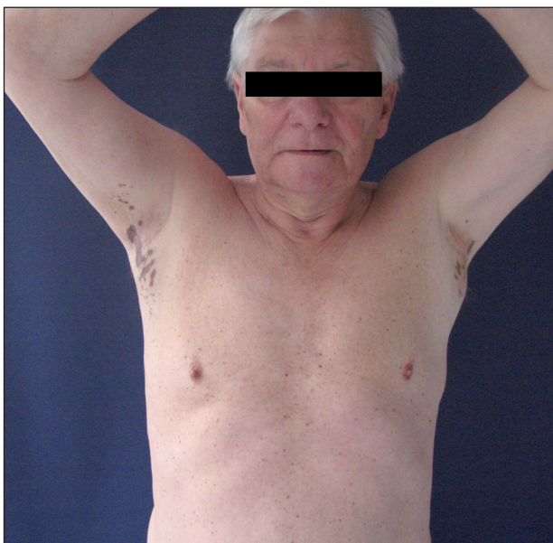
Obr. 1. Hnědočerné makuly v axilách.

Byla provedena probatorní excize. V mikroskopickém nálezu byla popsána lichenoidní reakce, atrofie epidermis, výraznější inkontinence pigmentu. Závěr: lichen planus pigmentosus inversus (obr. 3)