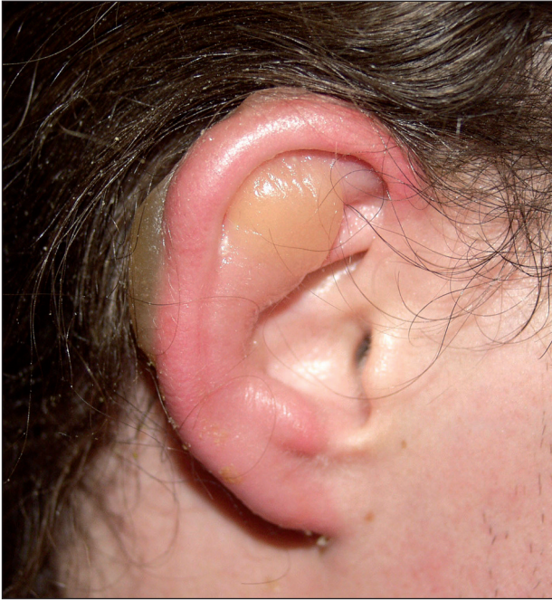
Obr. 7. Omrzliny boltce 2. stupně.

Léčba omrzlin byla v posledních letech přehodnocena. V současnosti se doporučuje rychlé zahřátí ve vodní lázni o teplotě kolem 40 °C po dobu 20 minut (podle různých autorů od 38–44 °C) (3, 4, 23, 28). Pokud již byla postižená oblast takto ošetřena, je velice důležité zabránit jejímu opakovanému prochlazení (např. při převozu), které by mělo mnohem závažnější následky než původní omrznutí (28). Nově se doporučuje heparinizace k usnadnění prokrvení v trombotizovaných periferních cévách. Účinný by měl být také pentoxifylin a protizánětlivé látky celkově (nesteroidní antiflogistika, podle některých studií methylprednisolon) (4). Také by měla následovat profylaxe tetanu.