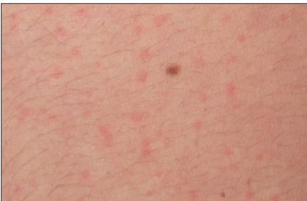
Obr. 12. Cholinergní kopřivka, detail.

a hrudník, ale může se šířit na končetiny i generalizovat (obr. 11, 12). Cholinergní kopřivka může být doprovázena celkovými příznaky, podobně jako jiné urtikárie. V léčbě se doporučuje profylaktické podání antihistaminik před expozicí vyvolávajícím faktorům (6, 23, 28). Prevencí je eliminace zjištěných příčin (28).