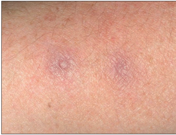
Obr. 6. Přetrvávající lividní erytémy po zhojení projevů na předloktí.

V histologickém nálezu byly patrné granulomy. Léčbu snášela pacientka velmi dobře, pravidelně byly prováděny oční kontroly a základní laboratorní vyšetření krve. Po odstranění posledního nodulu v 6/08 byla léčba ukončena.