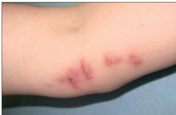
Obr. 5. Noduly bez sekrece na vnitřní oblasti lokte.

losis při 37 °C za použití pevných půd Löwensteinovy-Jensenovy, Ogawovy a tekuté Šulovy půdy. Současně byla na stejných půdách provedena kultivace při 33 °C. Mikroskopické vyšetření bylo provedeno standardně po obarvení metodou podle Ziehla-Neelsena (ZN) a fluorescenčně po barvení auraminem. V mikroskopických preparátech ze tkáně byly sporadicky detekovány acidorezistentní tyčky po barvení podle ZN (obr. 4) a početné tyčky při mikroskopickém vyšetření fluorescencí. Kvantitativní hodnocení růstu mykobakterií je uvedeno v tabulce 1. Kmen byl identifikován v Národní referenční laboratoři (NRL) pro mykobakterie molekulárně biologickou metodou GenoType Mycobacterium CM/AS jako M. marinum s citlivostí na ethambutol, cykloserin, ethionamid, kanamycin, amikacin, rifabutin, ciprofloxacín, ofloxacin, azithromycin a klarithromycin. Kmen byl rezistentní na izoniazid, streptomycin, rifampicin a para-aminosalicylovou kyselinu.