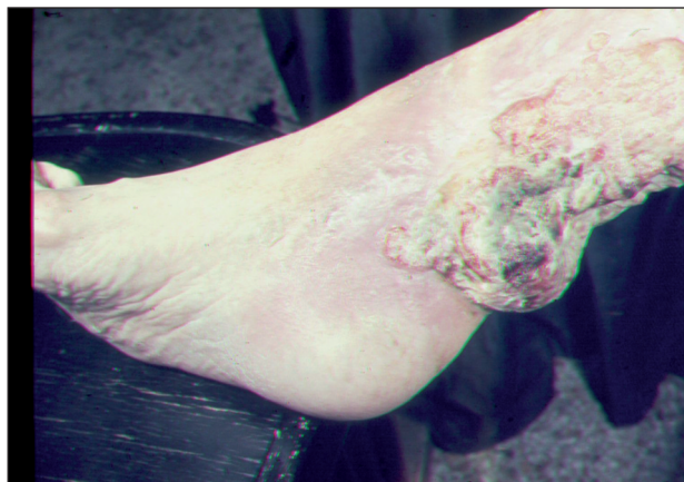
Obr. 10. Ca spinocelulare exulcerans.

Jednou z příčin bérčového vředu je rozpad tumoru. K nejčastějším nádorům, které vyúsťují v ulcerace patří: bazaliom, spinaliom, melanom, Kaposiho sarkom, angiosarkom, mycosis fungoides, metastázy vnitřních malignit do kůže. Na nádorovou příčinu onemocnění je třeba pomýšlet u nehojivých, na obvyklou léčbu nereagujících ulcerací (obr. 10).