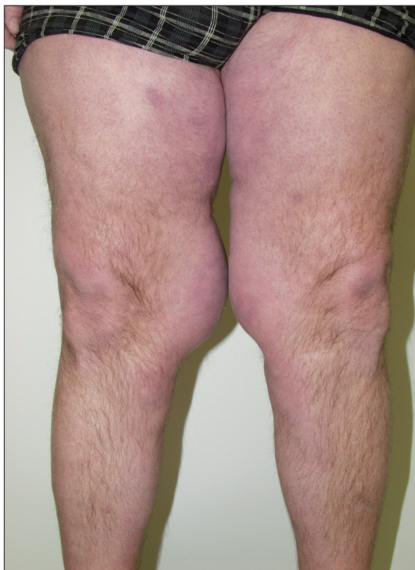
Obr. 2. Detail tukových depozit na stehnech.

Pacientkou byla 65letá žena, astmatička, hypertonička, s hypothyreózou, vředovou chorobou žaludku, po revmatické horečce v r. 1968 a cholecystektomii pro lithiázu v r. 1961. Dostavila se na naši kliniku pro 2 roky trvající symetrické zmnožení tukových valů na horních končetinách s maximem nad lokty. Pacientka byla nekuřačka, s negativní anamnézou abúzu alkoholu. Vyhledala nás pro progresi projevů v distálních partiích paží, kterou zaznamenala tím, že si nemohla obléci svoji oblíbenou halenku (obr. 3). Lipomatózu v rodině nikdo neměl. Z léků brala dlouhodobě molsidomin, hydrochlorothiazid, amilorid, levothyroxin a itoprid. V září 2003 prodělala i salmonelovou gastroenteritidu s difúzní hepatopatií. Rok