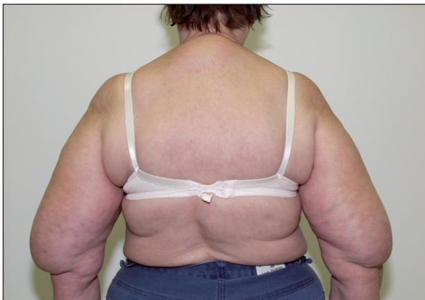
Obr. 4. BSL – pseudoatletický typ v kombinaci s Madelungovým krkem.

3,51 mmol/l (3,0–3,4 mmol/l) a snížení HDL 1,19 mmol/l (1,6–1,8 mmol/l). Kyselina močová a další laboratorní výsledky včetně markerů hepatitid a hormonů štítné žlázy byly v mezích referenčních hodnot. Sonografické vyšetření projevů na pažích prokázalo nápadně bohatou tukovou tkáň bez edému a bez omezení cévních a nervových svazků. Na USG jater byla zjištěna vyšší echogenita při difuzní hepatopatii v rámci výraznější steatózy, bez ložiskových změn v parenchymu. Lipomatóza byla zjištěna i v retroperitoneu.