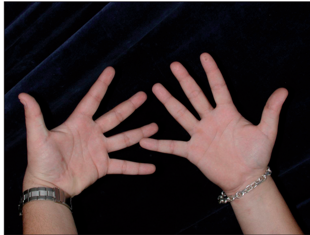
Obr. 3. Kontaktní ekzém na rukách u pacienta č. 1.