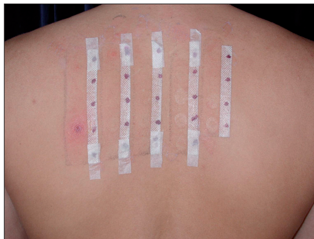
Obr. 4. Pozitivní epikutánní test na PPD a benzokain u pacienta č. 1.

vyšetřena v květnu 2004. Na počátku května si nechala na dovolené v zahraničí provést na bérce tetováž henu. Sedmý den se objevily v místě tetováže vezikuly na výrazně zánětlivém a edematózním podkladě (obr. 5, 6). Lokální nálezy se stále zhoršoval a byl provázen silným pruritem. Byla léčena 12 dní za hospitalizace lokálními kortikosteroidy s elastickou bandáží, ale i kortikosteroidy celkovými v dávce 200 mg hydrokortisonu denně po dobu 4 dní a antihistaminiky. Byla propuštěna zhojena. V únoru 2005 byly provedeny epikutánní testy rutinní sadou Trolab Hermal a byla prokázána kontaktní přecitlivělost na PPD na +++ (obr. 7). Testy byly odečítány po 24–48 a 72 hodinách. Primární senzibilizace vznikla nejspíše po barvení vlasů tmavou barvou v minulosti, aniž došlo ke vzniku kontaktního ekzému.