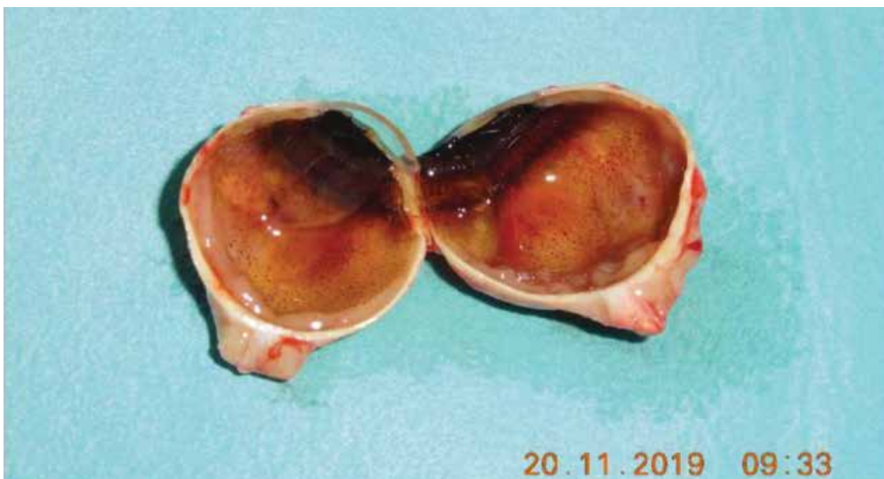
Obrázok 2.: Bulbus po enukleácii: intrabulbárna masa 2x1 cm s cirkulárnym prerastaním okolo zrakového nervu

teľná amočná odozva vo všetkých kvadrantoch, odlúčenie choroidey, terč zrakového nervu prekrytý tumorom, rozšírenie zrakového nervu a negatívne echo v hrúbke 5mm. Magnetická rezonancia preukázala nepravidelné zhrubnutie steny ľavého bulbu, obraz plošného zhrubnutia choroidey do hrúbky 2,8 mm, prítomné retrobulbárne šírenie v okolí terča zrakového nervu a iniciálneho úseku zrakového nervu s rozmermi 14x5,5 mm a obraz plošnej amócie sietnice. Mozgový parenchým bol na magnetickej rezonancii intaktný. Vyšetrenie optickou koherentnou tomografiou nebolo možné zrealizovať, pacientka nefixovala ľavým okom. Fluoresceínová angiografia nebola realizovaná pre jednoznačný nález tumorózneho intraokulárneho ložiska s postihnutím iniciálneho úseku zrakového nervu na ultrasonografii