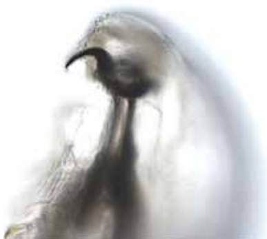
Obrázek 5. Detail pravého rostrálního háčku larvy Oestrus ovis při pohledu z ventrální strany (200x zvětšení)

S myiasou se v našich klimatických podmínkách pravděpodobně můžeme setkávat u cestovatelů do jižních krajů po návratu z oblastí s velkým počtem ovcí a tím i střečků. V zemích non-endemických může představovat diagnostickou výzvu pro lékaře neseznámeného s tímto zamořením, obzvláště pokud jsou postiženy jiné orgány než kůže [7]. Napadení člověka střečkem je udáváno v případě nárazu plodné samice do pacientova oka a jeho okolí. Bývá to hlášeno pastýři ovcí a na venkově ve Středomoří, tropických a subtropických zemích [8].