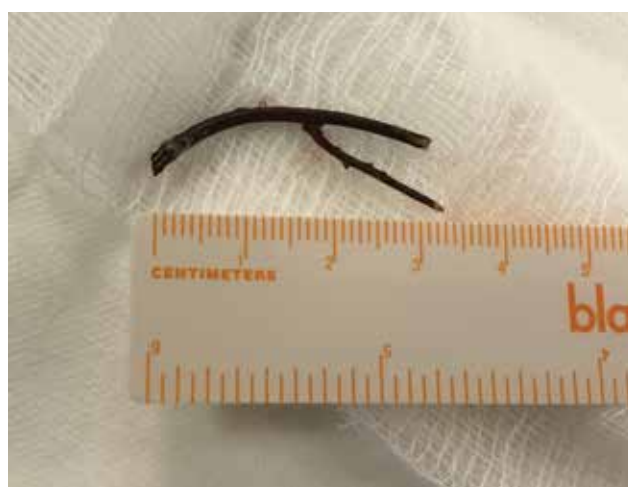
Obrázek 4-b. Extrahovaná větvička z přední části očnice

U kontuzí očnice je nutné pamatovat, že dle některých prací až 29,4 % může být spojeno s blow-out zlomeninou očnice [17]. Proto by tito pacienti měli být důsledně vyšetřeni včetně zobrazovací metody.