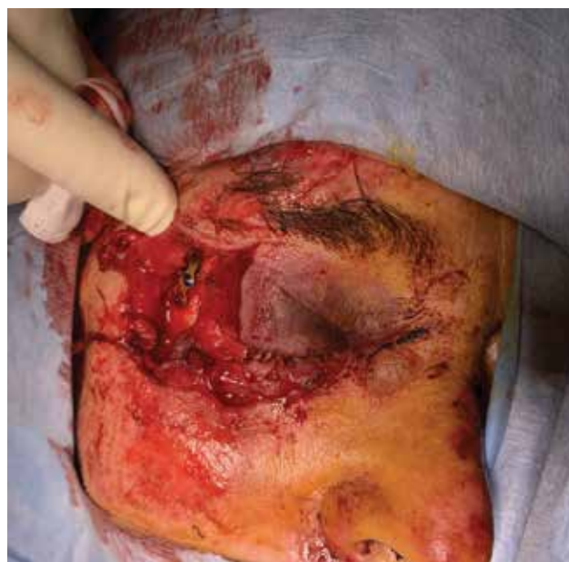
Obrázek 6-a. Těžké poranění očnice a víček při autonehodě. Je patrná již provedená rekonstrukce zlomeniny vnější stěny očnice stomatochirurgem

U všech traumat bychom měli ověřit, zda má pacient platné očkování proti tetanu a zda je rekonstrukci možné provést v lokální anestezii. Obecně ale platí, že pro rozsáhlá poranění víček, poranění slzných cest,