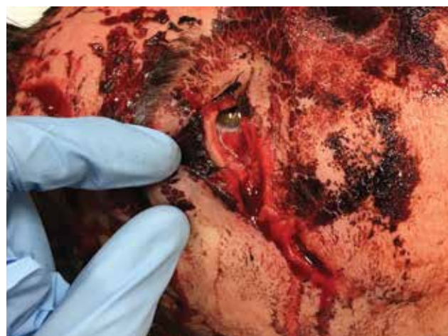
Obrázek 3-a. Otevřená rána zevního koutku, včetně vytrženého dolního kantálního ligamenta. Pacient po autonehodě