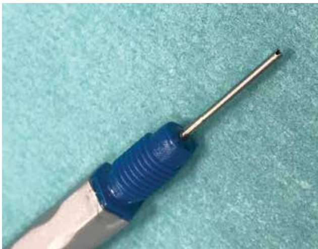
Obrázok 2. Detail koncovky Nanosekundového lasera

mentáciou šošovkových hmôt za pomoci irigácie a aspirácie.