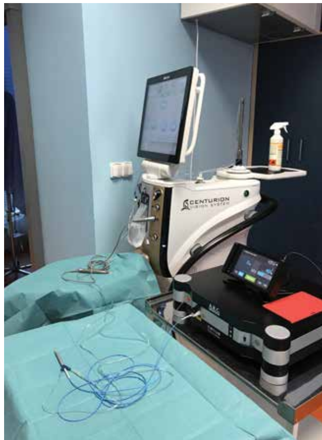
Obrázok 3. Pohľad na spojenie oboch prístrojov

Priemerné percento hexagonálnych buniek pred operáciou bolo v skupine I. 71,25 \pm 3,79\% , v skupine II. 69,75 \pm 4,35\% . Týždeň po operácii to bolo v skupine I. 68,50 \pm 4,52\% a v skupine II. 68,42 \pm 5,66\% . Zmeny boli v jed-